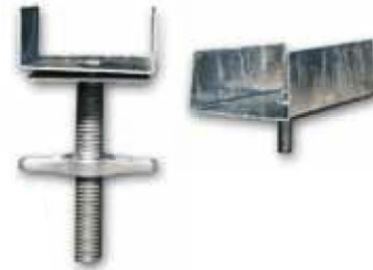
CABEZAL A HUSILLO