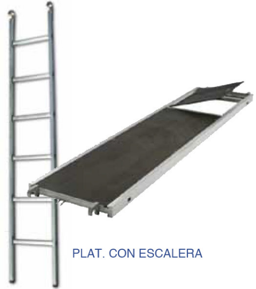
PLAT. CON ESCALERA