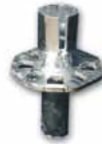
TUBO DE UN DISCO